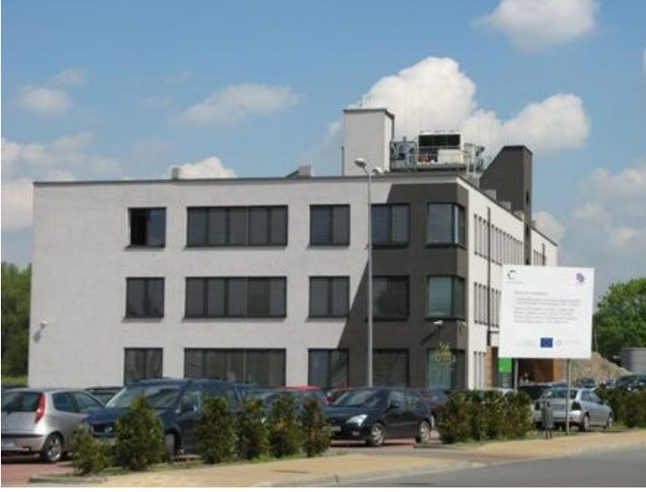
Euro-Centrum Enerji Tasarruflu Bina: Tavanın camla kaplı olması koridor aydınlatmasını sağlamaktadır.