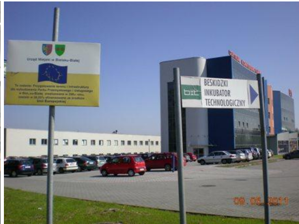
BIT (Beskidzki Inkubator Technologiczny)

Programın ilerleyen günlerinde yukarıda özet bilgileri verilen projelere ilişkin detaylı görüşmeler yapılmıştır.